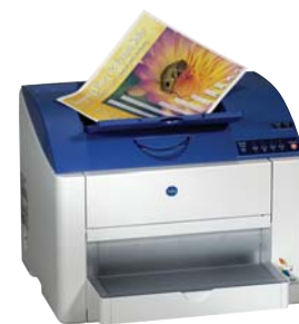
magicolor 2400W con bandeja incorporada